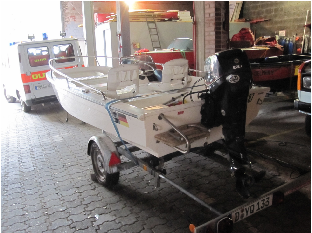
Halle an der Eschenstraße in Rheinhausen

Zurzeit werden große Teile des Wasserrettungsmaterials auf mehrere Standorte verteilt gelagert und teilweise ungeschützt draußen geparkt. Was einen höheren Verschleiß und ein Vandalismus Risiko bedeutet. Eine Halle mit entsprechendem Rolltor von 300 bis 500 qm wäre hier für die Zukunft zwingend erforderlich.